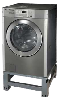
socle en option

Note : le chauffage électrique peut être désactivé pour les sites disposant d'eau chaude à 65°C et qui souhaitent des cycles ultra-courts, notamment pour les laveries self-service.