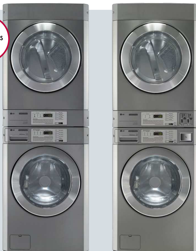
colonne sans monnayeur

Gage de qualité et de facilité de maintenance, les 2 circuits de commande demeurent totalement indépendants.